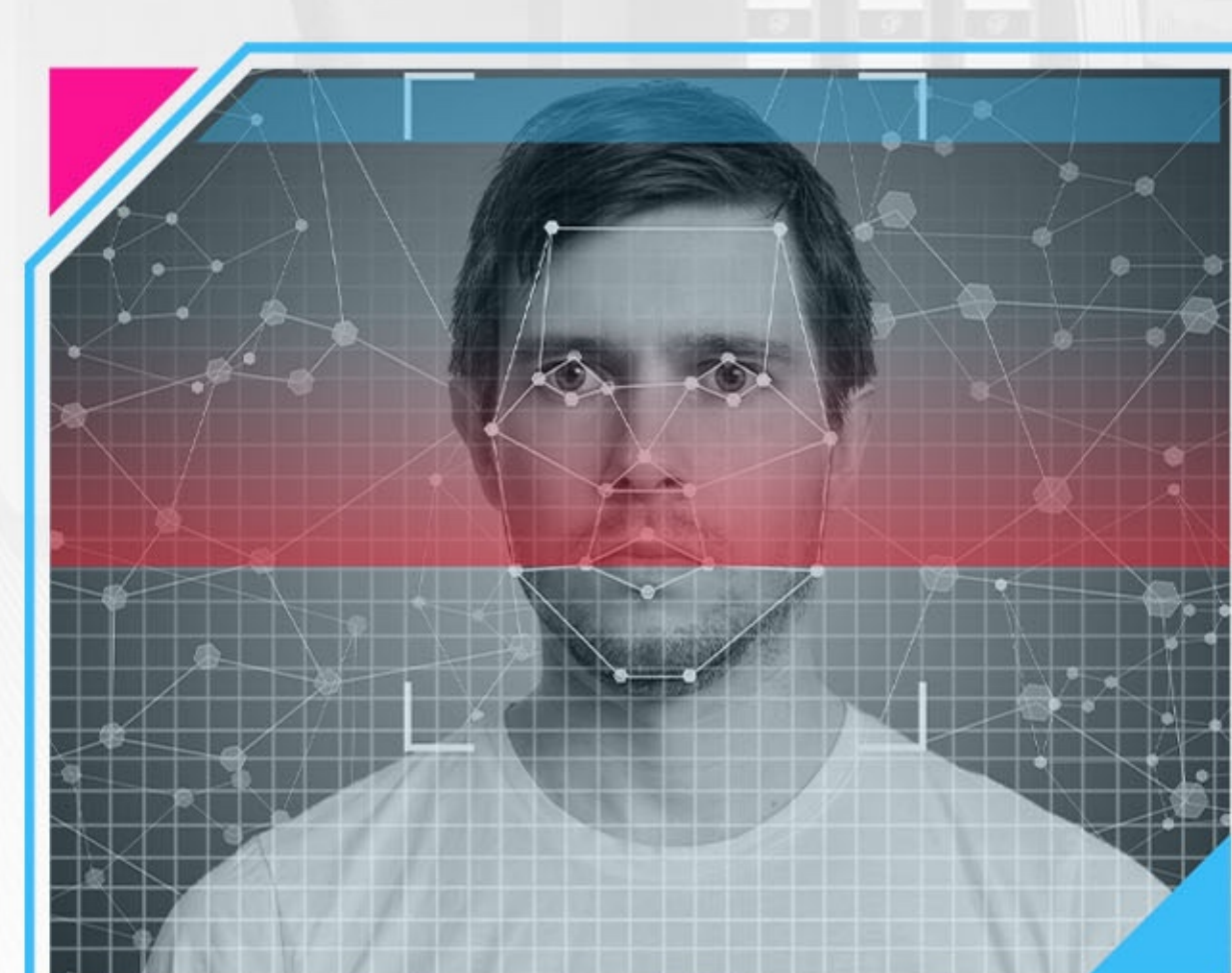
1.3 MPX ИНФРАКРАСНАЯ КАМЕРА