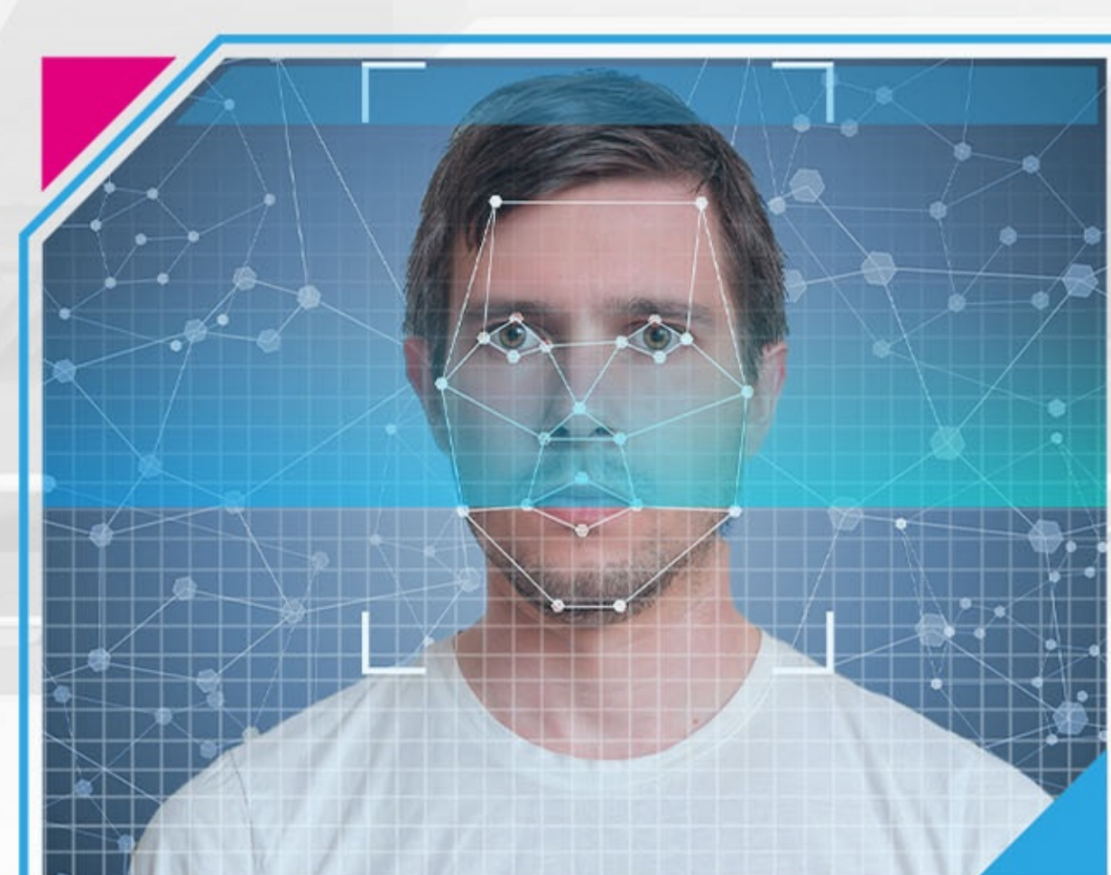
2 MPX RGB КАМЕРА